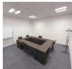
ミーティングルーム2D