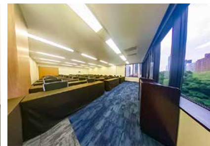
カンファレンスルーム 4B (8)