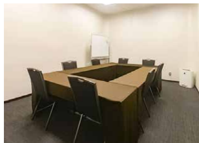
ミーティングルーム A (6)