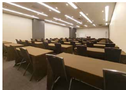
ホール B (2)