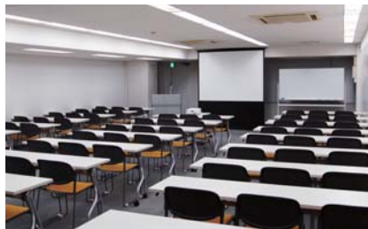
カンファレンスルーム