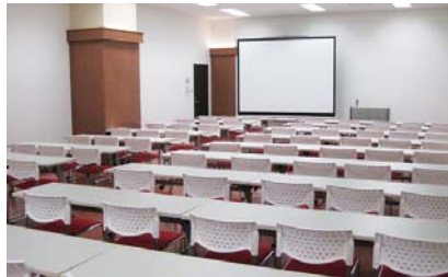
カンファレンスルーム