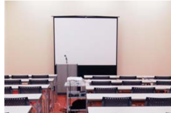
カンファレンスルーム

1Fカンファレンスルーム・ミーティングルームでは全6室でインターネットをご利用頂けます。当日のご予約も承ります。